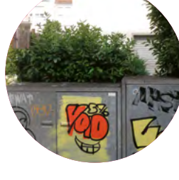
DIREKT BEI STERN-NR.