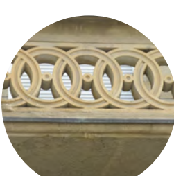
DIREKT BEI STERN-NR. (SCHAU NACH OBEN)