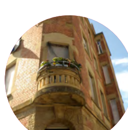
GEGENÜBER VON STERN-NR. (SCHAU NACH OBEN)

Hast Du alle „Sterne-Stempel“ eingesammelt und die drei Details im Viertel entdeckt? Dann trage einfach die richtigen Nummern ein und gib die ausgefüllte Karte bei einem der „Sterne“ ab.